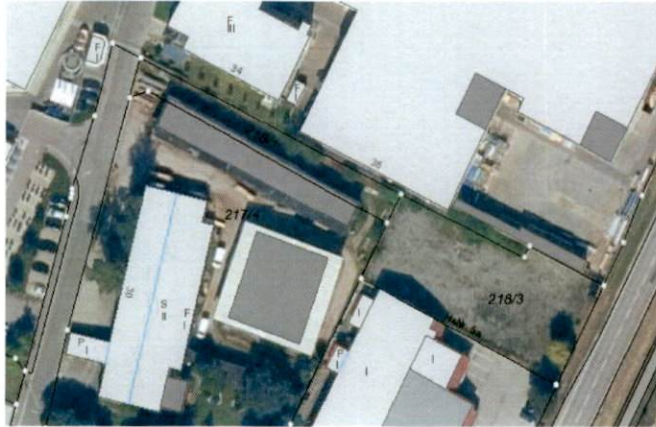
Abbildung 3: Orthofoto Plangebiet